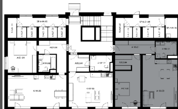
UMÍSTĚNÍ BYTU NA PODLAŽÍ