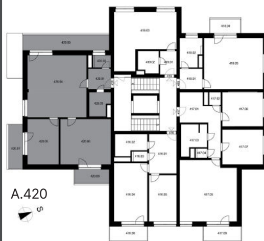
UMÍSTĚNÍ BYTU NA PODLAŽÍ