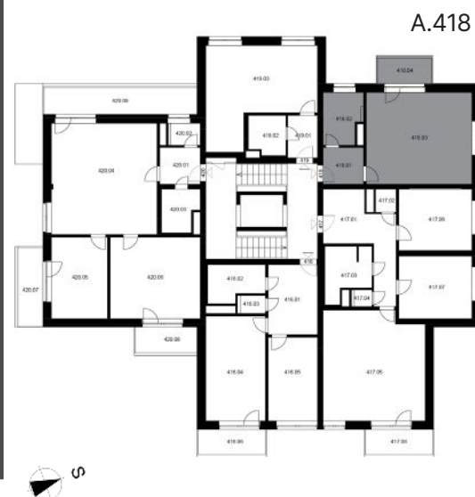
UMÍSTĚNÍ BYTU NA PODLAŽÍ