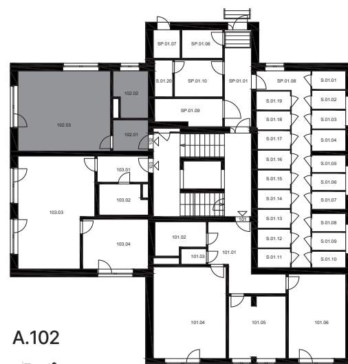
UMÍSTĚNÍ BYTU NA PODLAŽÍ