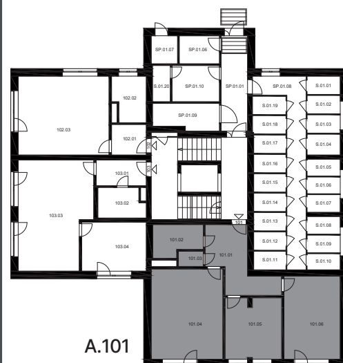
UMÍSTĚNÍ BYTU NA PODLAŽÍ